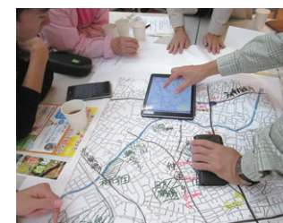
2018年10月20日 和泉第二町会「DIG」教習会