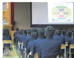
2017年1月17日 阿佐谷中学校全校生徒向け「防災講演会」

同時に区内各諸団体からの「講演会」「勉強会・ワークショップ」「防災企画」等の依頼に応じて、年間15回ほどの「出前講演・勉強会」を行っています。