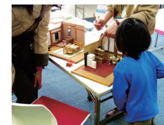
すぎチャリ2016 出展 デモ実演「部屋のレイアウト間違い探し」