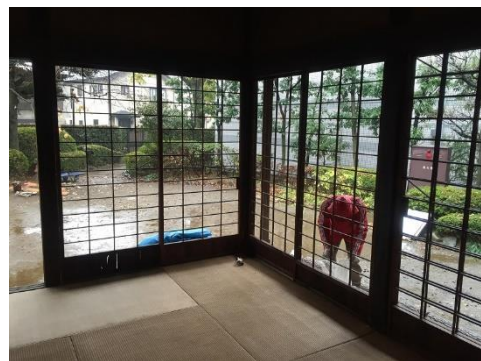
H26年、年末の大掃除のお手伝いの様子。毎年障子もすべて張り替えています。