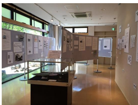
H29/3「杉並の路線バス展」の様子。自分たちでパネルを作成しています。

展示実施の際には、連動企画として展示解説や各種ワークショップ、講座なども自分たちで企画します。