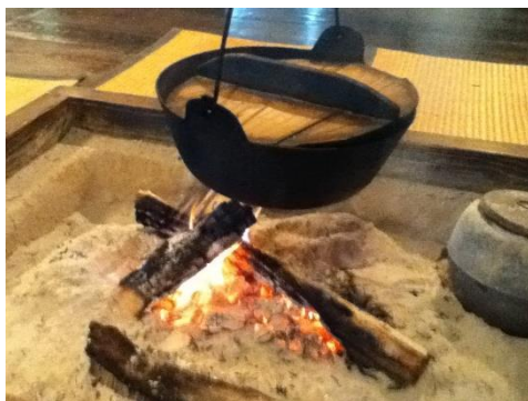
囲炉裏の火をかこみながら、たまたま集まった来客同士で話の弾むこともあります。

その他、古民家で行われる各種イベントのお手伝いなどのボランティア活動も積極的に行っています。