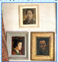
父の自画像、母と祖母

田坂さんは4歳から成田東にお住まいです。その頃は田んぼと畑の中にぽつんと家が点在する寂しいところでしたが、近所同士のお付き合いがありました。小学生の頃、近所の友人が蓄音機でバッハやベートーヴェンの演奏を聴かせてくれました。田坂さんは初めて聴く西洋の音楽に魅了されましたが、当時は戦争の真っ只中。お父様が病気で亡くなり、お祖母様が畑を耕し、お母様が仕事をしながら息子たちを育てていました。田坂さんは新聞配達を始め、中学生になった頃、バイオリンを購入して先生について稽古を始めました。授業料が払えないため進学は断念。18歳で横田基地のジャズバンドに参加してお金を稼ぎ始めます。進駐軍のダンスパーティが華やかに開催されて、バンドはひっぱりだこでした。テレビの歌番組の生演奏や録音もこなし、首相官邸で演奏することもありました。 30代の頃、もっと音楽の勉強がしたい、自分の技術を上げないとプロの演奏者として申し訳ないと新婚の奥様とロンドンに旅立ちます。そこで恩師イーフラ・ニーマン先生の指導を受けました。レッスンの傍ら、たくさんの音楽会に行きヨーロッパの音楽を肌で感じる日々の中、生徒たちにバイオリンを教え始めました。当初1、2年の予定でしたが、レッスン料が入ったので7年ほど滞在。帰国後は、本格的にバイオリン教師の仕事と演奏活動を再開しました。筑波にバイオリン教室を構えて多くの生徒を指導し、成田のアトリエでは「モーツァルトプレイヤーズ」と名付けた仲間たちと、思う存分合奏を楽しみました。 田坂さんは未だにバイオリンの技術に自信がもてないと言われます。ただ音を奏でる瞬間、音楽に満たされていることを全身で感じるそうです。多くの人の導きで音楽の道が開かれたことや、生活の苦勞を担い、音楽人生を支えてくれた奥様に感謝をしながら、地域の皆様と演奏を通して幸福な時間を過ごしたいと希望を抱いています。