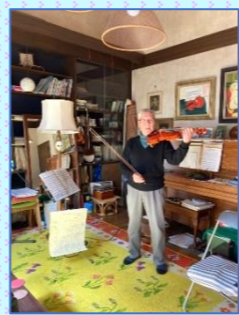
ご自身で設計したアトリエにて