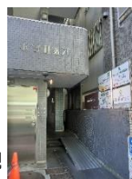
五日市街道側入り口

窓口受付時間：月曜～金曜 午前9時～午後7時 土曜 午前9時～午後1時 夜間・日曜祝日・年末年始 も電話でのご相談は24時間 受け付けています。