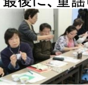
▲男雛を折りました