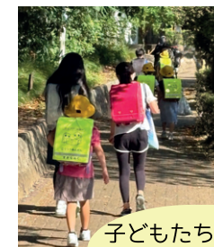
子どもたちの登下校に合わせて パトロールを実施

「おはようございます」「こんにちは」の挨拶・声がけでつながる安全・安心で暮らしやすい地域づくりに取り組んでいます。こうした活動が地域の犯罪や交通事故を抑制するだけでなく、地域コミュニティの強化にもつながっています。