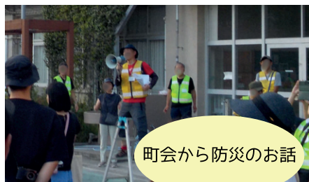
町会から防災のお話

大規模な災害が起きますと、行政からの支援がすぐには届かないことも想定されます。だからこそ大切なのが「自助」と「共助」。町会では防災訓練などを通じて、地域で助け合える体制を日ごろから準備しています。共に備えることで、安心が生まれます。