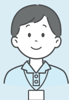
マンション単独で 自治会を立ち上げ

また、行政との関わりも強くなり、避難所の運営会議や防災訓練への支援等により、防災体制を強化することができました。