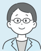
地域の町会に加入

マンションにお住まいで、地域の町会に加入されている方、マンション単独で、自治会を立ち上げている方の声を紹介します。