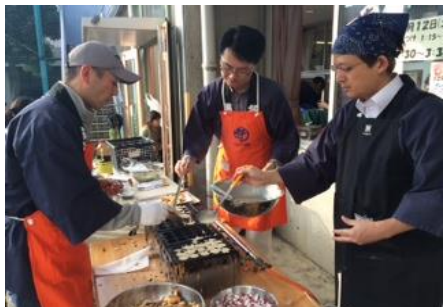
イベントの手伝い

今年度も学校行事だけでなく、地域のイベントのお手伝いもしました。桃一まつりではテント設営や焼きそば、わたあめ作り、パトロールなどで活躍しました。桃一キッズ、児童館や地域のおまつり、もちつき大会などでも、なくてはならない存在でした。