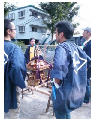
中通明和会子供みこし