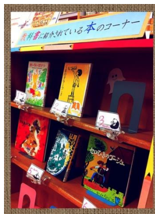
↑おすすめ本 紹介コーナー