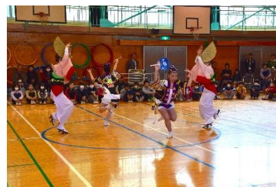
伝統文化を学ぶ(阿波踊り)