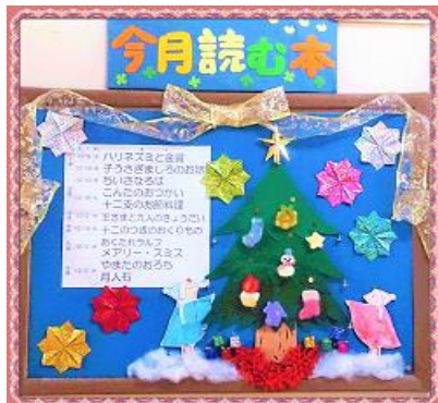
校長室前「今月読む本」紹介掲示板

年に2回ある読書旬間には「お昼休みお話し会」を開催して、たくさん子どもたちが参加してくれました。校長室前の廊下にある掲示板には、毎月の読み聞かせ本の紹介を、子どもたちが楽しめるよう工夫して掲示しています。