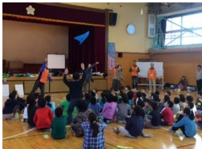
桃一キッズ「紙ヒコーキ大会」共催