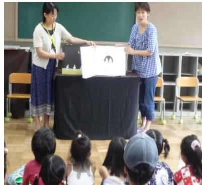
桃一まつりで「おはなしのへや」