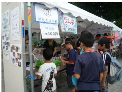
桃一まつりで「ラムネ屋さん」

事務局は各団体がスムーズに活動できるように、学校や地域、保護者の方たちと連携を図りました。またホームページを毎月更新し、各団体の活動の様子を紹介しました。桃一まつりでは「ラムネ屋さん」を出店し、今年度も大盛況でした。