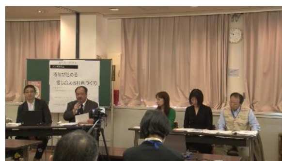
シンポジウムの様子